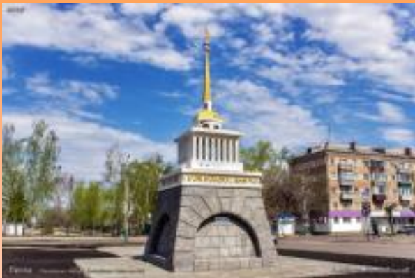
Памятник героям блокадного Ленинграда