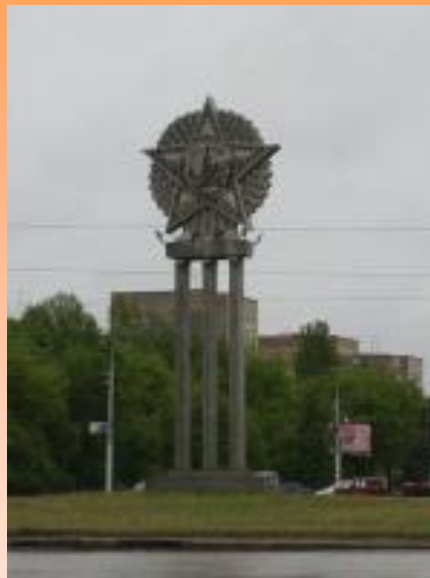
Стела «Орден «Победы»