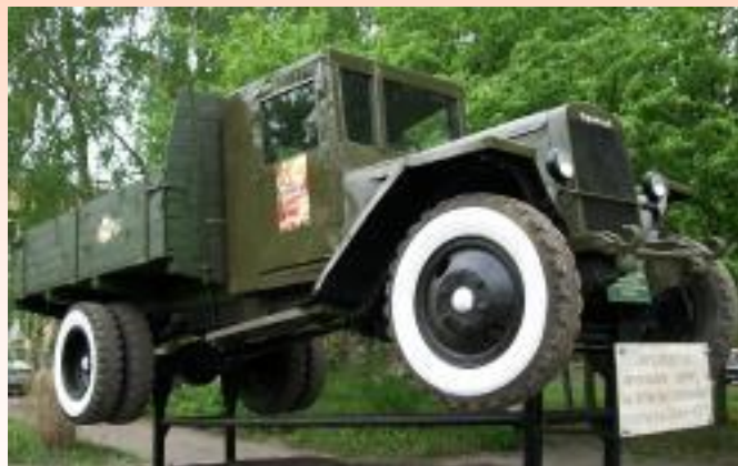
Монумент «Автомобиль фронтовых дорог и ветеран послевоенных пятилеток»