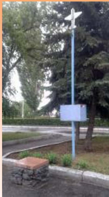
Памятный знак авиаторам